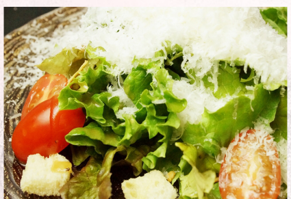
Классический салат «Цезарь» с сыром пекорино 860 йен