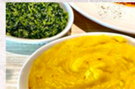
Mashed Potatoes and Creamed Spinach Set ¥800