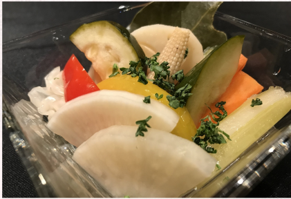
Colorful Vegetable Pickles ¥480