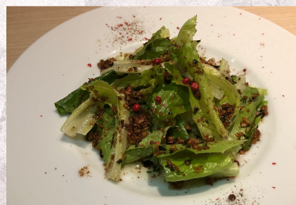
Салат с анчоусами 580 йен