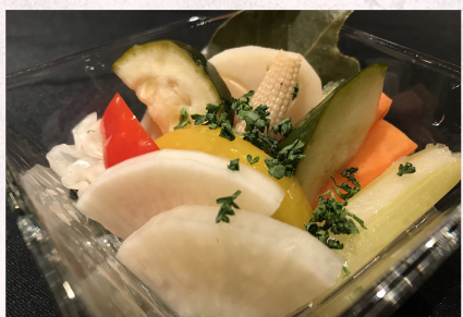
Красочные овощные маринады 480 йен