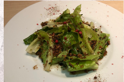
Anchovy Lettuce Salad ¥580