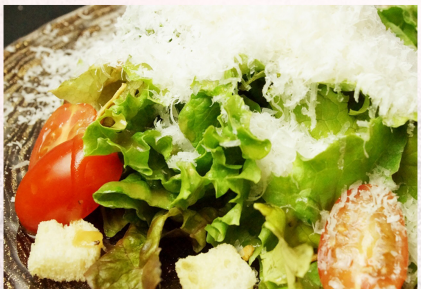
Classic Caesar Salad with Pecorino Cheese ¥860