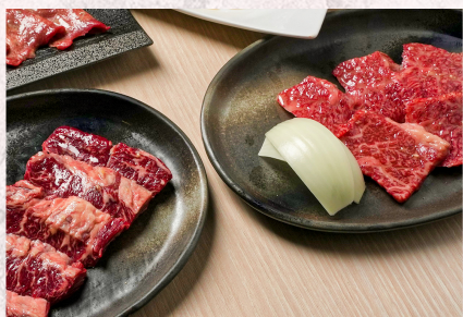
Ассорти из трех видов говяжьей вырезки (180 г) ¥2,680