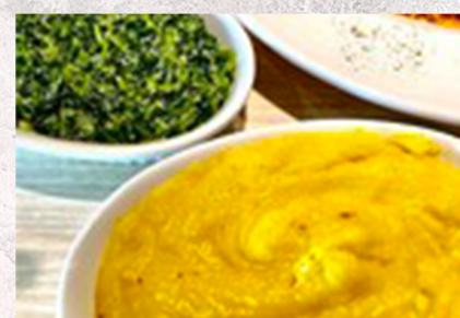
Пюре из картофеля и шпинат со сливками, 800 йен